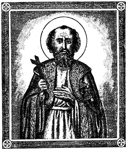
СВ. КНЯЗЬ МИХАИЛЬ ТВЕРСКОЙ.