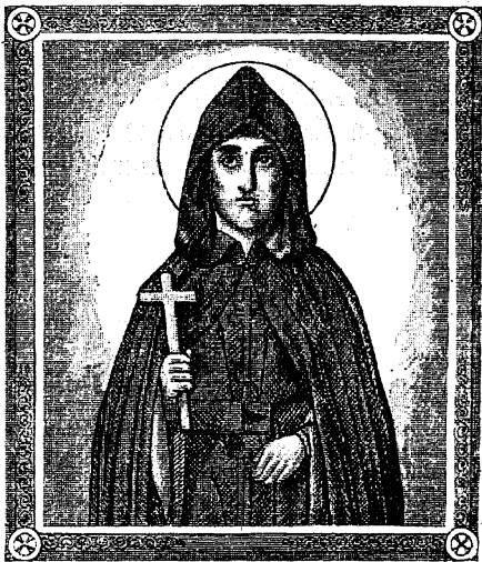
СВ. ПРЕПОДОБНАЯ КСЕНІЯ.