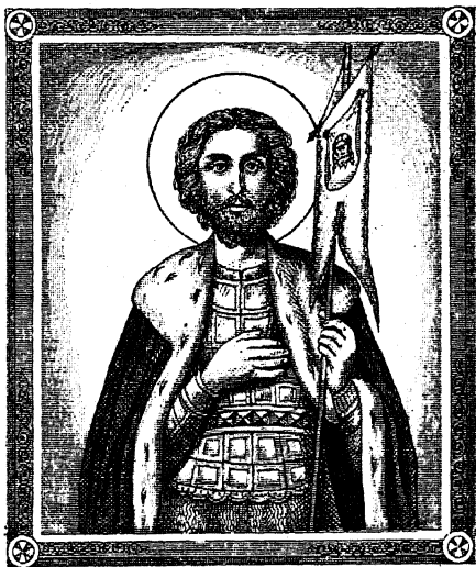
СВ. БЛАГОВѢРНЫЙ ВЕЛИКІЙ КНЯЗЬ АЛЕКСАНДРЪ НЕВСКІЙ.