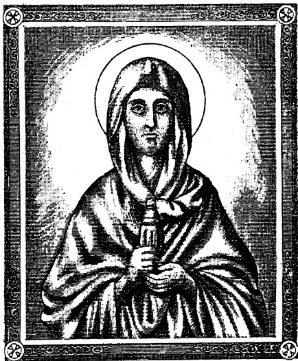
СВ. МАРІЯ МАГДАЛИНА.