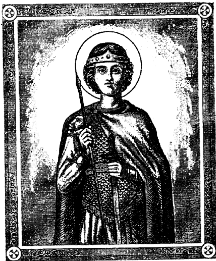
СВ. ГЕОРГІЙ ПОБѢДОНОСЕЦЪ.