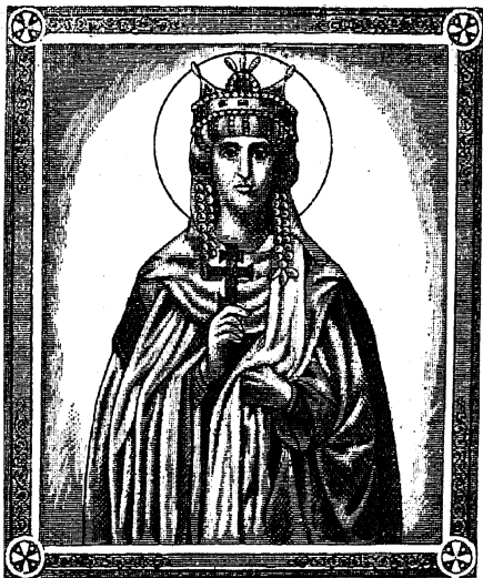
С В. К Н Я Г И Н Я О Л Ъ Г А .