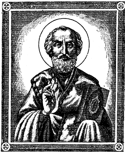
СВ. НИКОЛАЙ ЧУДОТВОРЕЦЪ.