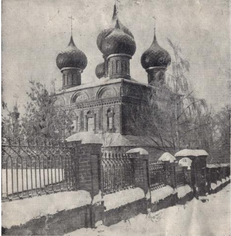
Церковь Воскресения в Добре. Вид с юго-востока