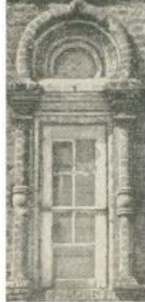
Окно южного фасада храма