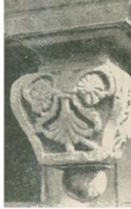
Белокаменная гирья южного крыльца

от теплой золотисто-желтой до плотной красно-коричневой. В сочетании с голубыми, пепельно-серыми, светло-зелеными и оливковыми тонами фона и пейзажа они образуют спокойную, несколько приглушенную красочную гамму, на которой неяркими пятнами горят малиновые, темно-вишневые и изумрудно-зеленые цвета одежд и предметов.