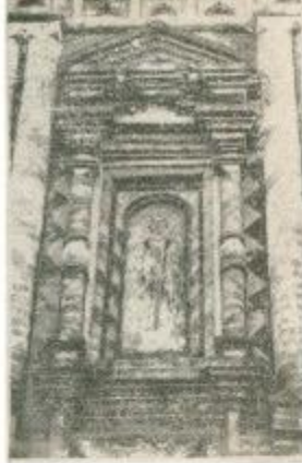
Фрагмент фасада Трехсвятительского придела