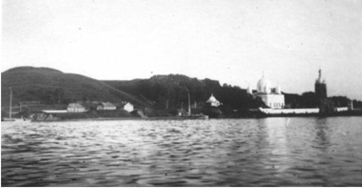
Вид с Галичского озера на гору Столбище (Балчуг) и Никольский Староторжский монастырь.

воевали Галич с пригороды в 7065 (1557) году и в это время сожгли в Солигаличе означенный монастырь.