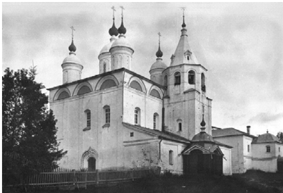
Церковь Успения Божией Матери в Паисиевом монастыре.

Другая церковь — во имя Святой Живоначальной Троицы, с двумя приделами: во имя священномученика Антипы и великомученика Димитрия мироточивого. О времени построения означенных церквей сведений в монастырских документах не сохранилось. При монастыре на Костромской дороге устроена часовня для сбора подаяний, обновленная в 1861 году.