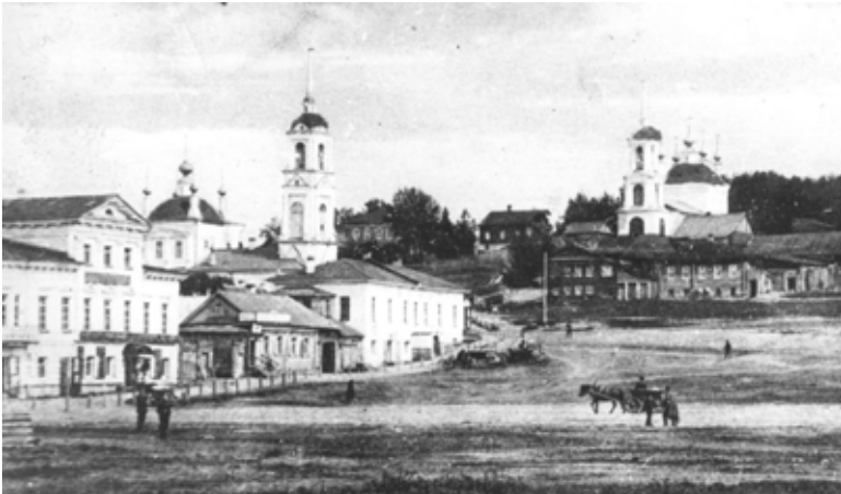
Восточный угол Торговой площади. Церкви Вознесения (Георгиевская) и Воскресения Иисуса Христа (справа).

За эти величания, как молодой, так и гости, дарят девушек деньгами. На сельских и деревенских свадьбах пируют не более 3-х дней, а для бедняков они бывают крайне обременительны в материальном отношении.