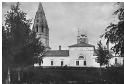
Рождества Иисуса Христа. Построена 1654 года.