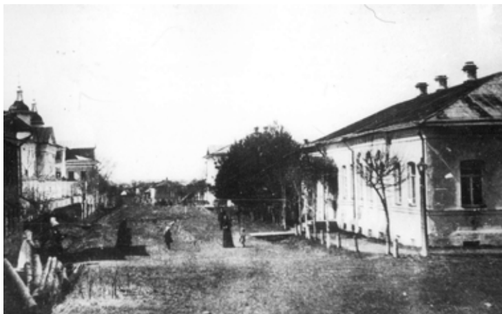
Городское училище на Благовещенской улице.

Училищ в Галиче пять: духовное, городское 3-классное, приходское, женское и рыбнослободское городское училище для мальчиков и девочек.