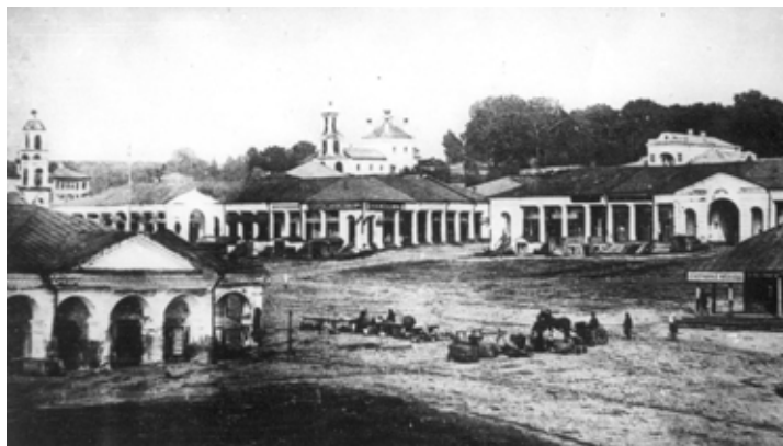
Торговая площадь и Гостиный двор.

Вид на Галич с колокольни церкви Константина и Еленыского, Кологривского и окружающих его больших торговых сел, среди которых он стоит главным центром производства и торговли. Вышеозначенные уезды и села так тесно связаны с Галичем, что операции оптовых покупок, необходимых для торговли, производятся здесь. Станция же Буй стоит в стороне и не может принести такой очевидной пользы для внутренних уездов Костромской губернии. Вот почему и желательна была бы ветка из Костромы на Галич.