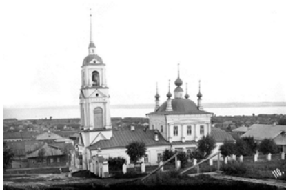
Вознесения Иисуса Христа (Георгиевская – прим. ред.). Построена 1801 года.