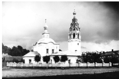
Святой великомученицы Варвары. Построена 1794 года.