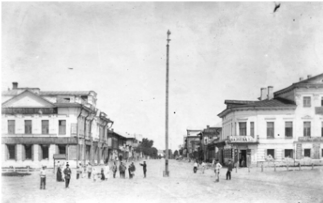
Улица Пробойная. Вид с Торговой площади.

Галич с уездом имеет народонаселения до 127.000. Хлебопашеством жители занимаются неохотно, и в летнее время дома остаются только малолетние, женщины и старики; мужчины же, с 15-летнего возраста, отправляются на заработки в Петербург и Москву. Галичане считаются искусными плотниками, печниками, малярами и кровельщиками. Они лето работают в столице, а зимою, если не занимаются мелочною торговлею, возвращаются по деревням.