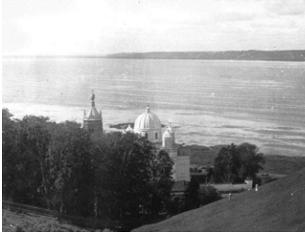
Вид с горы Столбище на Галичское озеро и Никольский Староторжский монастырь.

одно время с Галичем Волынским; впрочем, селение мерячей здесь существовало гораздо прежде Галича Волынского. По указаниям некоторых источников, первоначальное название города было «Галивон»; «Галич-Мерский» — происходит от заселения в старину этой местности язычниками — меря. Озеро называлось Нерон.