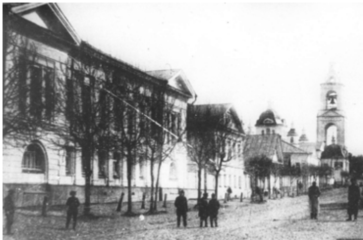
Здание Духовного училища на Успенской улице.

Училищ в Галиче пять: духовное, городское 3-классное, приходское, женское и рыбнослободское городское училище для мальчиков и девочек.