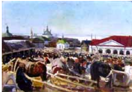
Часовня св. Макария у Гостиного двора. С картины С.А.Власова.

Собору принадлежит каменная часовня, поблизости Гостиного двора, устроенная гражданином Иваном Шилковым в память великого наводнения, бывшего 25 июля 1810 года.