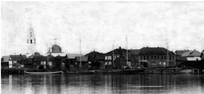
Пристань возле улицы Набережной.

Рыбу продают на базаре в Галиче жены рыбаков; есть скупщики, которые покупают рыбу возами и развозят по соседним городам. В весеннее время, при половодии рек, открывается для Галича водяное сообщение с Волгою через посредство реки Вёксы, которая впадает в Буе в реку Кострому, и около 30 лодок работают для перевозки кладей. Реки, впадающие в озеро, Чёлсма и Шокша, изобиловали налимами и раками, но теперь они почти не попада-