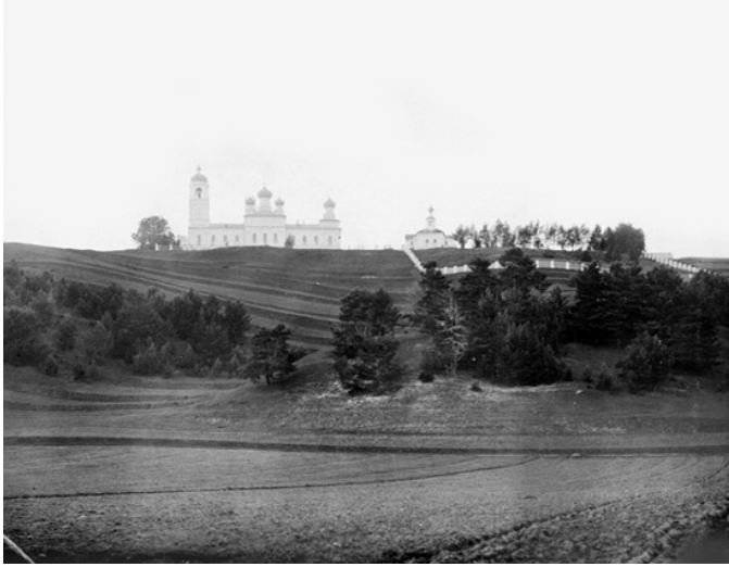
Церковь Успения Божией Матери и Заозерский Авраамиев монастырь.