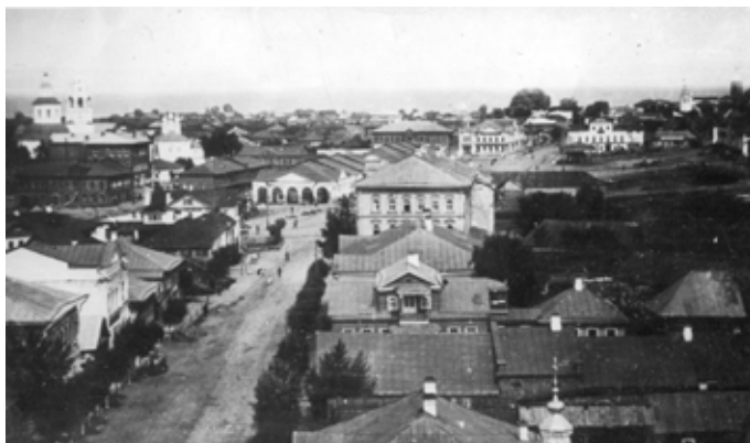
Центр города и Успенская улица.

В настоящее время цивилизация коснулась, наконец, и Галича. В 1905 году закончится сооружение железнодорожной линии Вологда-Вятка, что даст более удобный и легкий способ общения города в промышленном и торговом отношении со столицами.